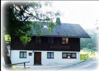
Skihütte & Clubhaus Bernau Bernau im Schwarzwald

Melde dich schnell an und sei dabei. Wir freuen uns auf dich ☺