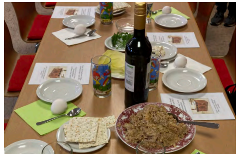
Sedertisch mit Textblatt, Symbolspeisen und Getränk: Rotwein, Traubensaft, Eier, Petersilie, Salzwasser, Apfel-Nuss-Mus, Chicoree und Meerrettichpaste.

An Gründonnerstag feierten rund 50 Erwachsene und Kinder im Gemeindehaus einen Sederabend. „Seder“ ist hebräisch und heißt „Ordnung“. Dieses Essen wird in jüdischen Haushalten am Vorabend des Passahfestes gefeiert. So auch damals bei Jesus mit seinen Jüngern am Vorabend seines Todes. Während dieses Essens, bei dem Speisen mit Texten aus der Geschichte vom Auszug Israels aus Ägypten verknüpft werden, setzte Jesus damals das heute bekannte Abendmahl ein. Am Sederabend in unserer Gemeinde kamen ergänzend zu den alttesta-